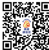
115學年度上學期 課後班報名

本校為服務家長與學生課後照顧之需求，開辦課後照顧班，內容為家庭作業書寫、團康及生活照顧等。課後班老師將盡可能協助作業的完成，但因每個孩子書寫速度不同，許多孩子的作業仍需家長多協助與關心。若有特殊需求，老師將依狀況請求家長的支援與協助，以達到學生最佳的學習品質。