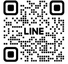
興華國小課後班 Line官方