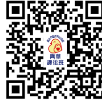
115學年度上學期 課後班報名

本校為服務家長與學生課後照顧之需求，開辦課後照顧班，內容為家庭作業書寫、團康及生活照顧等。課後班老師將盡可能協助作業的完成，但因每個孩子書寫速度不同，許多孩子的作業仍需家長多協助與關心。若有特殊需求，老師將依狀況請求家長的支援與協助，以達到學生最佳的學習品質。